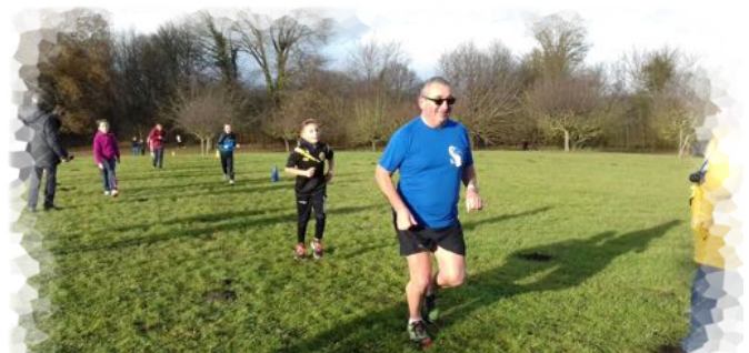
Cet athlète a gardé le sourire dans l'épreuve, Dieu merci

- Un grand bravo à l'équipe qui a organisé la course pour le téléthon des écoles de La Fresnaye-sur-Chédouet. En dépit du temps et surtout de l'actualité (décès de Johnny Hallyday) la mobilisation va permettre de soigner des personnes atteintes de myopathie.